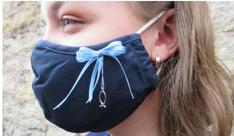
Seite 18 Konfirmationen