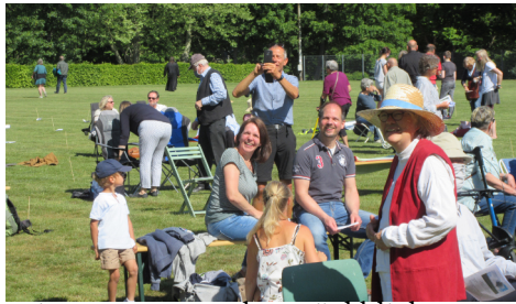
Seite 8 Jahresrückblick 2020