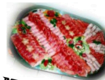
Mollensper und Stümpelplatten aus eigener schlachtung