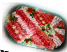
Mollensper und Stümpelplatten aus eigener Schlachtung