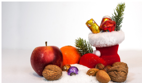
Seite 17 Nikolaus für Kinder