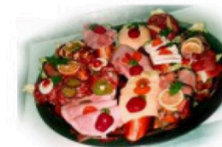
Belegte Brötchen und Canapés