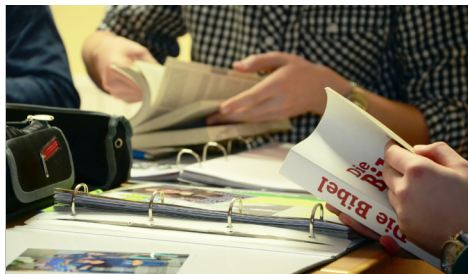
Seite 7 Anmeldung Konfizeit