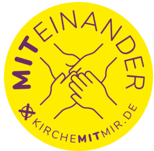
S. 10 Kirchenvorstandswahl