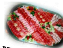
Mollenvesper und Stümpelplatten aus eigener schlachtung