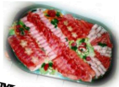
Mollenvesper und Stümpelplatten aus eigener Schlachtung