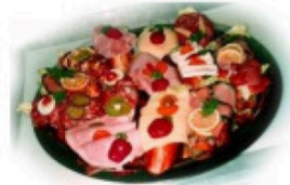
Belegte Brötchen und Canapés