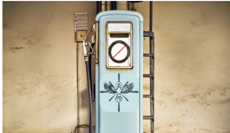
Seite 19 regionale Sommerkirche