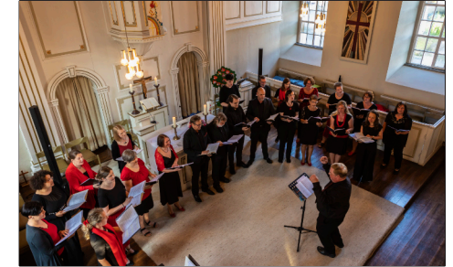
Weihnachtskonzert mit dem Chor Belcanto in der Elliehäuser Kirche