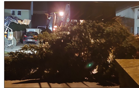
Tannenbaumspende der Familie Kruse für die Kirche in Esebeck