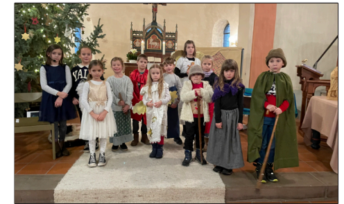
Krippenspiel in Esebeck