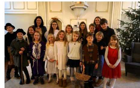
Krippenspielkinder in Elliehäuser