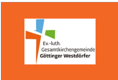
S. 26 Info Gesamtkirchengemeinde