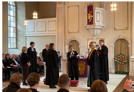
Ordination am 17. Februar