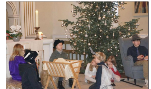
Heiligabend in der Elliehäuser Kirche