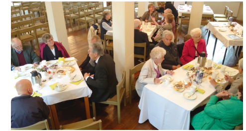
..in der Elliehäuser Kirche