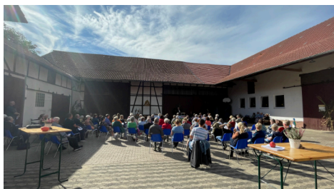
Erntedank-Gottesdienst in Esebeck