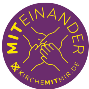
S. 16 Kandidaten KV-Wahl 2024