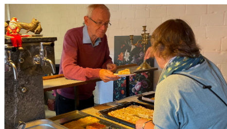
...mit Kaffee und Kuchen