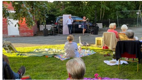
..... bei Sonnenschein auf der Wiese hinter der Kirche