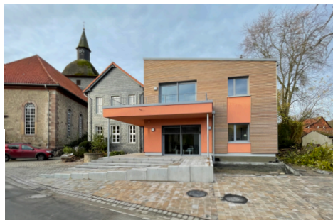
S. 8 Einweihung Anbau Gemeindehaus