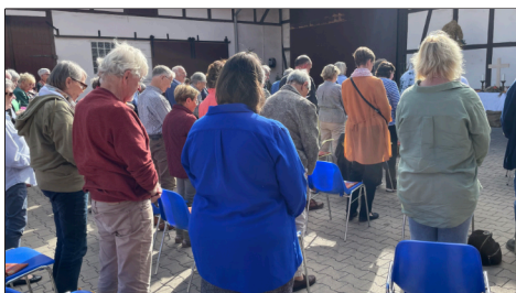
Auf Teutebergs Hof