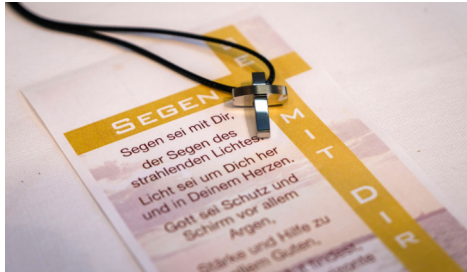
Seite 10/11 Konfirmationen