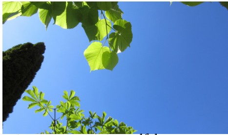
Seite 4 Himmelfahrt