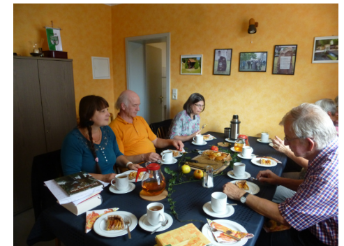
Stärkung für Leib und Seele im Stiftungsstübchen