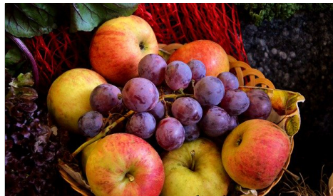
Seite 17/18 Erntedank