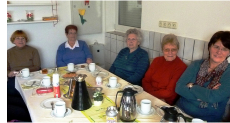
Gute Gesellschaft im alten Milchhäuschen

Vorlesecafé und Stiftung Dempewolf gehören einfach zusammen! Von Anbeginn (2008) dieses Angebots unserer Kirchengemeinde hat die Stiftung unentgeltlich Räumlichkeiten (inklusive Heizungskosten und Geschirrbenutzung) zur Verfügung gestellt: in den ersten Jahren im ehemaligen Milchhäuschen, später dann in den früheren Räumen der Raiffeisen-Bank in einem Gebäude Herrn Dempewolfs, die von ihm der Stiftung zur Nutzung überlassen wurden unter dem Namen: Stiftungsstübchen. Auch an dessen neuen Standort, in den umgestalteten Geschäftsräumen der früheren Firma Dempewolf, durften wir uns bis zum Ausbruch der Corona-Pandemie treffen.