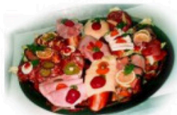
Belegte Brötchen und Canapés